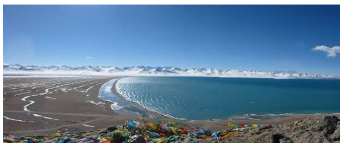
ナム湖からのニエンチンタンラ西山群

ニエンチンタンラ西山群中央部に位置し、未踏では同山群で最高と推定される。奥まった位置にあるため南東側を走るチベット鉄道や集落からは見えない。Bada (or Pata) は地元の神の名、Ri は「山」の意。