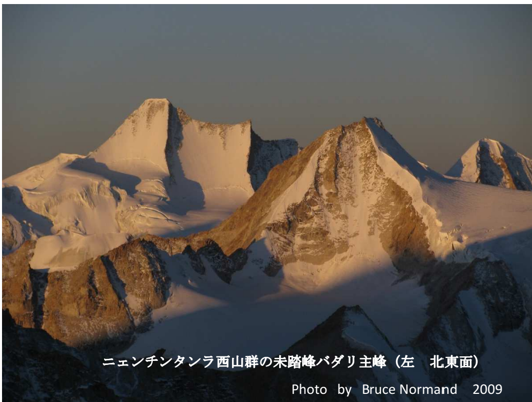
ニエンチンタンラ西山群の未踏峰バダリ主峰 (左 北東面)